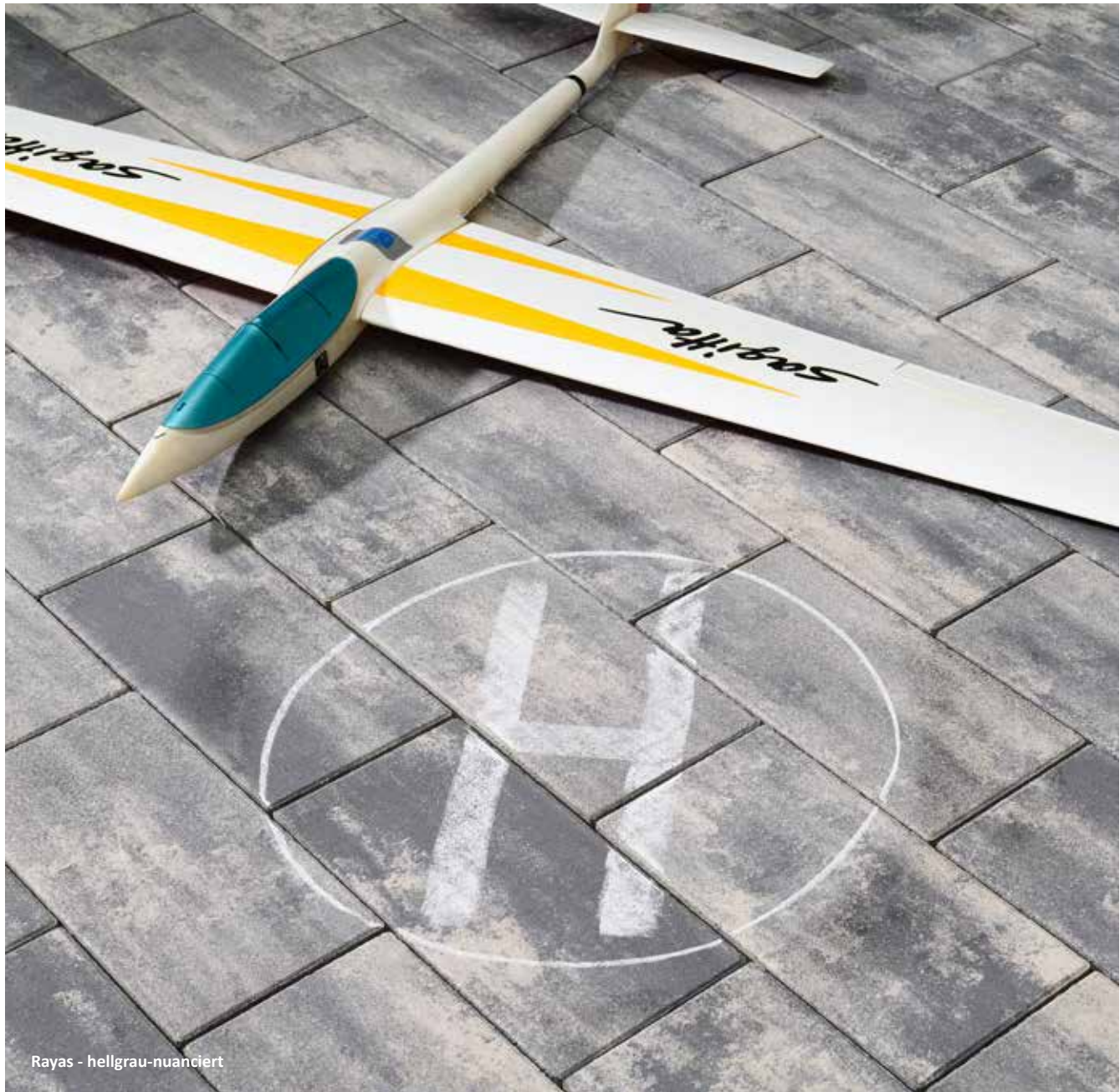
Rayas - hellgrau-nuanciert