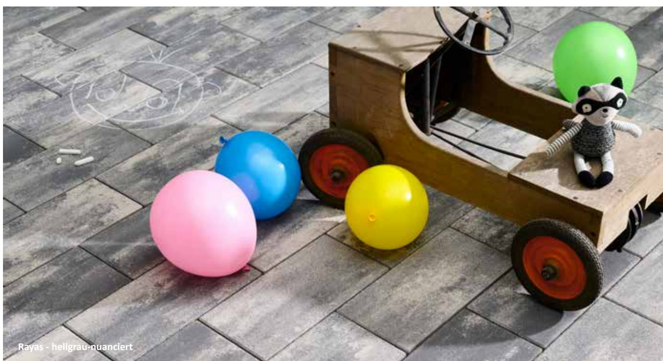
Rayas - hellgrau-nuanciert