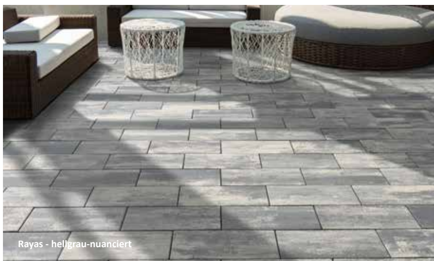
Rayas - hellgrau-nuanciert