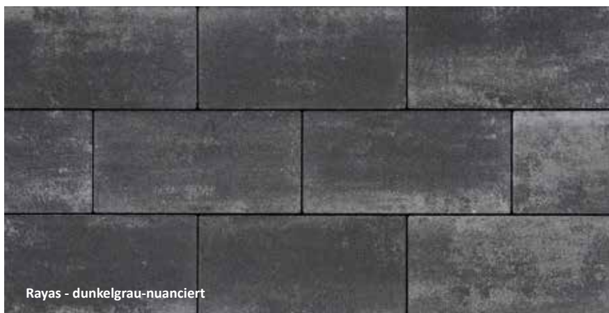
Rayas - dunkelgrau-nuanciert